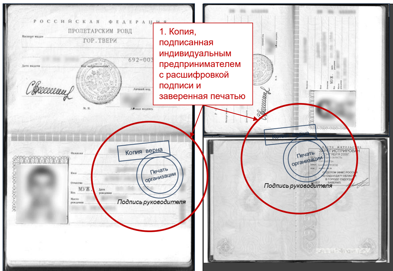
Способ заверения № 2